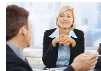
Anwaltsempfehlung auf Wunsch